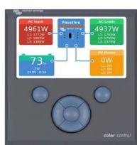
Color Control GX