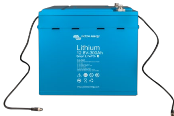
12,8V 300Ah LiFePO 4 Batterie

Dies ist sehr nützlich, um ein (mögliches) Problem wie ein Zellenungleichgewicht zu erkennen.