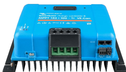
Contrôleur de charge SmartSolar MPPT 150/100-Tr VE.Can sans écran