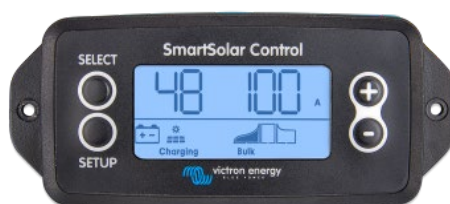
Écran à brancher SmartSolar