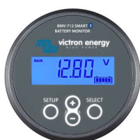
Détection Bluetooth : Contrôleur de batterie BMV-712 Smart