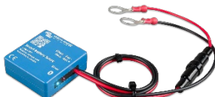
Bluetooth-Sensorik: Smart Battery Sense