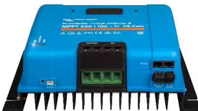
SmartSolar-Lade-Regler MPPT 250/100-Tr VE.Can ohne Display