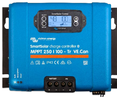
SmartSolar-Lade-Regler MPPT 250/100-Tr VE.Can mit Option einsteckbares Display