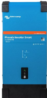
Convertisseur Phoenix Smart 12/2000