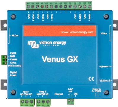
Venus GX mit Steckern