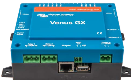
Venus GX Vorderansicht