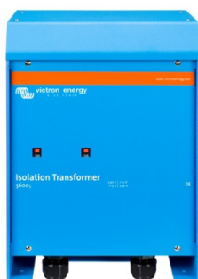
Isolation Transformer 3600W

Recommandation importante: lorsque le bateau est momentanément à terre (hivernage) il est recommandé de relier provisoirement la terre du secondaire à celle du réseau d'alimentation 230V afin de maintenir la sécurité du réseau électrique.