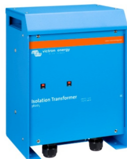
Isolation Transformer 3600W