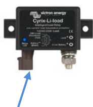
Voyant d'état LED